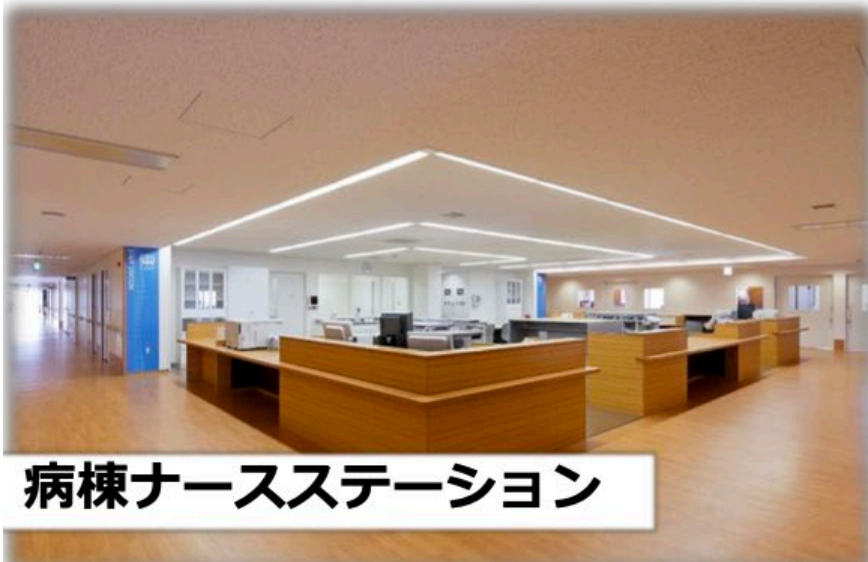
病棟ナースステーション